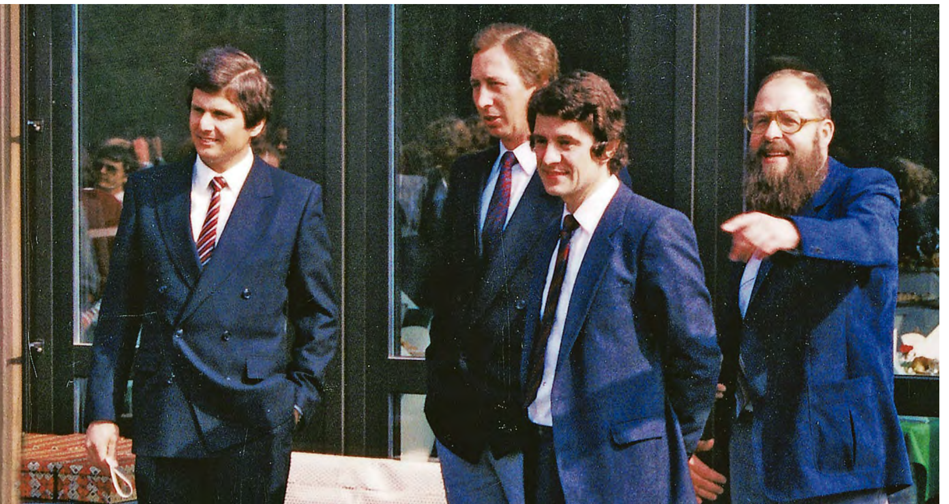
Zehn Jahre SAP: Vier der Gründer im Jahr 1982 (von links): Dietmar Hopp, Hans-Werner Hector, Hasso Plattner, Klaus Tschira.